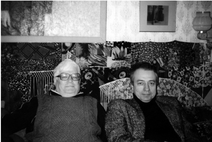
В квартире ВС, 1 декабря 1996 г.

Иногда возникали и споры. Хорошо помню один из них. Он произошел зимой, в конце 1968 или в начале 1969 года. В 1968 г. вышла потрясшая меня книга – «Психология искусства» Л.С. Выготского с замечательным предисловием Вяч. Вс. Иванова. В ней Выготский давал единое, инвариантное определение произведения искусства. Определение было сугубо психологическое. В нем Выготский использовал слегка обновленное понятие катарсиса, посредством которого Аристотель объяснял эстетическое воздействие искусства. Суть этого определения сводилась к тому, что в произведении искусства идет борьба двух начал: содержания – того, что излагается, и формы – того, как это содержание излагается. Так вот, катарсис определялся Выготским как отрицание формой произведения его содержания – победа формы над содержанием. Эта победа и вызывает у человека катарсис, говоря метафорически, светлое чувство на печальном фоне (вспомним пушкинское «Печаль моя светла...»). По утверждению Выготского, это справедливо для всех жанров: от басни до театральной трагедии. Например, у Шекспира содержательно (по фабуле) Гамлет гибнет. Но форма подачи этой гибели и последовательности событий, ей предшествующей (сюжет), такова, что Гамлет остается победителем. Его смерть не вызывает гнетущего чувства... Так же и для басни – минимального жанра художе-