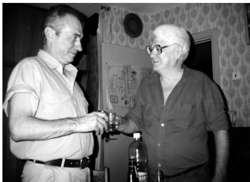
В гостях у ВС, июнь 1998 г.