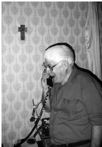
Взрывной смех ВС, июнь 1998 г.